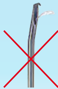
Beispiel einer Portkanüle Example of port needle