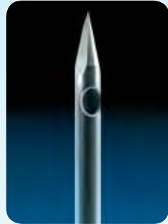
SFN®-Portkanüle SFN®-Port needle