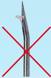
Huberkanüle Huber needle