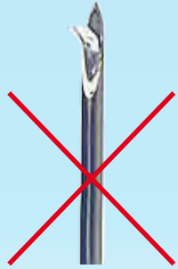
Standardkanüle Standard needle